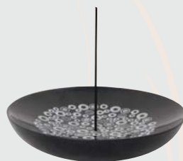
Räucherstäbchenhalter SATURN Tellerform H: 3 cm, Ø 15,5 cm G16097