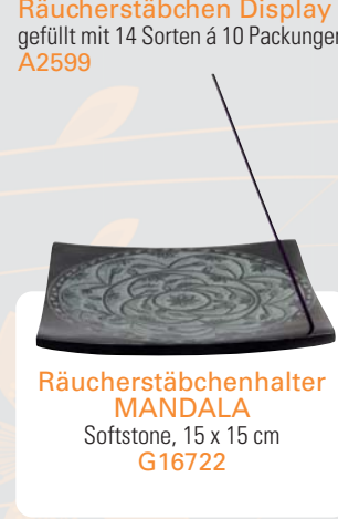
Räucherstäbchenhalter MANDALA Softstone, 15 x 15 cm G16722