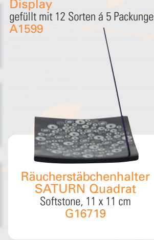
Räucherstäbchenhalter SATURN Quadrat Softstone, 11 x 11 cm G16719