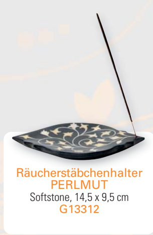
Räucherstäbchenhalter PERLMUT Softstone, 14,5 x 9,5 cm G13312