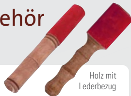
Holz mit Lederbezug Klangstab SC45045 L 18,5 cm, Ø 3,0 cm SC45050 L 18,5 cm, Ø 4,3 cm

BITTO's Klangschalen-Sortiment erhalten Sie bei: